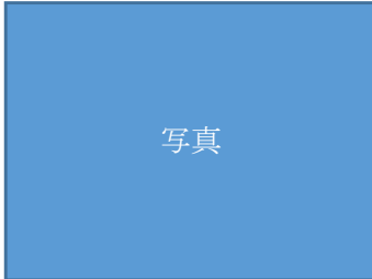
6年 フィールドワーク