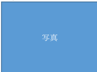
2年 バルーンミュージアム